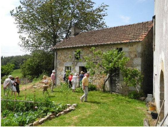
Dépendance avec seccadou.