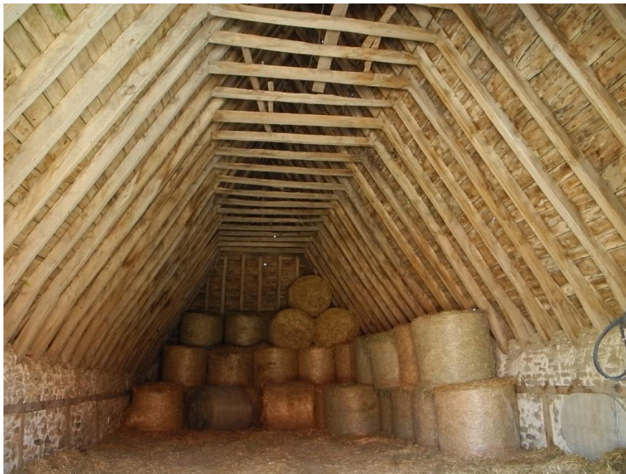
Porche (daté 1752) et intérieur de la grange 2 (XVIII e )