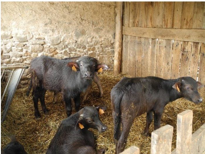
L'élevage de bufflones.