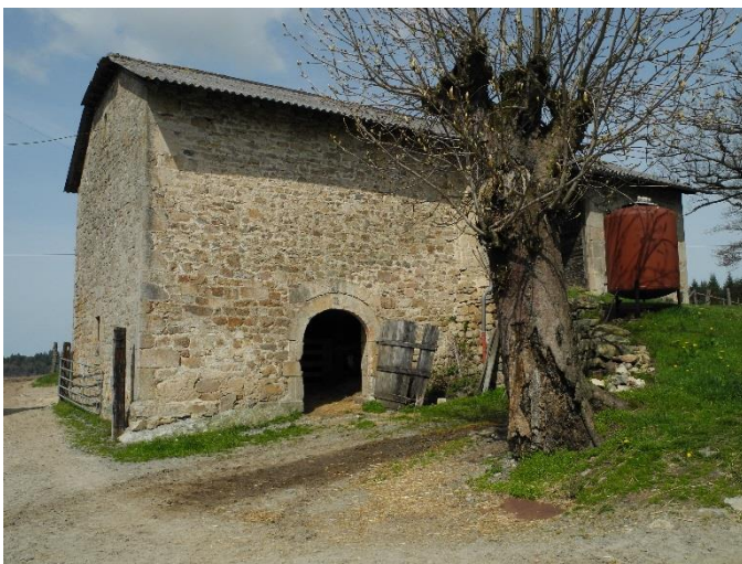
Grange 3 (XIX e )