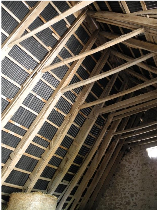
Grange 1 (XVII e )