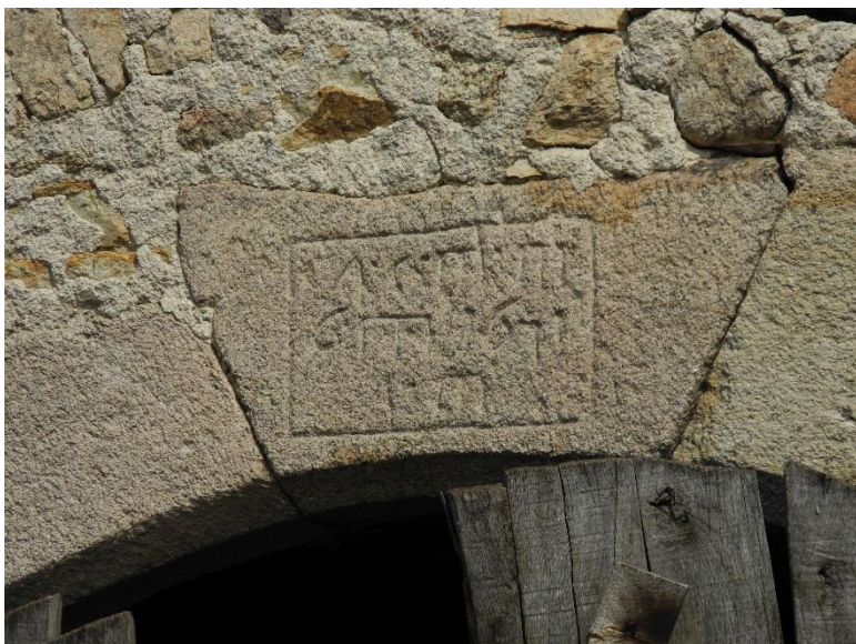
Porche de l'étable de la grange 1 (XVII e )