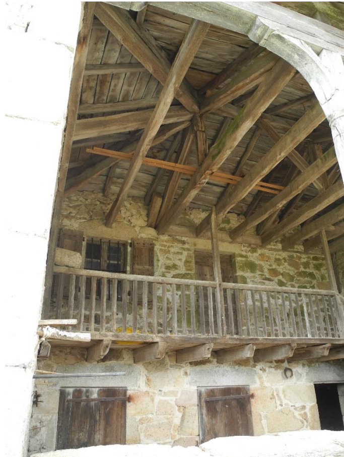
-Dominant le hameau, grange à clocheton, restaurée.