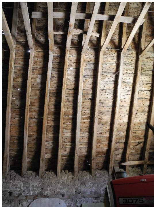
Grange 2 (XVIII e )