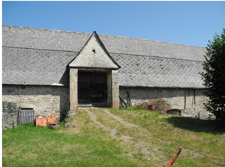
A proximité de cet ensemble, dépendance et fontaine intéressante