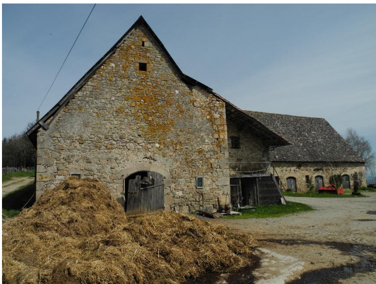
Granges 1 et 2

Situé sur une hauteur, il se compose d'une maison de ferme accompagnée de trois granges, le tout situé à proximité de ce qui peut être qualifié de véritable petit château. On accède à celui-ci par la cour de ferme :