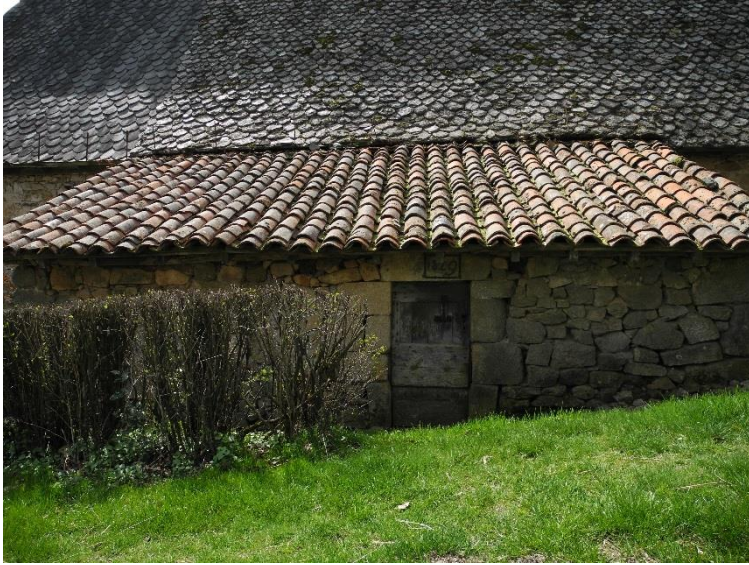
Appentis (XIX e ) contre la grange 2.